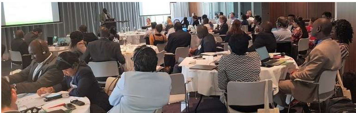
Présentation lors de la Rencontre internationale PNIN, Amsterdam, 22-24 mai 2019

Toutefois, plusieurs experts ont réitéré leur mise en garde au sujet de cet objectif et ont conseillé d'amener les attentes à un niveau réaliste et réalisable pour l'initiative PNIN au cours des deux prochaines années. Les experts et les pays ont également souligné que « l'institutionnalisation » / « la durabilité » dépendra de la qualité des résultats de la PNIN et de sa capacité à répondre à la demande des parties prenantes, faisant de ces priorités de mise en œuvre les conditions de « l'institutionnalisation » / « la durabilité ».