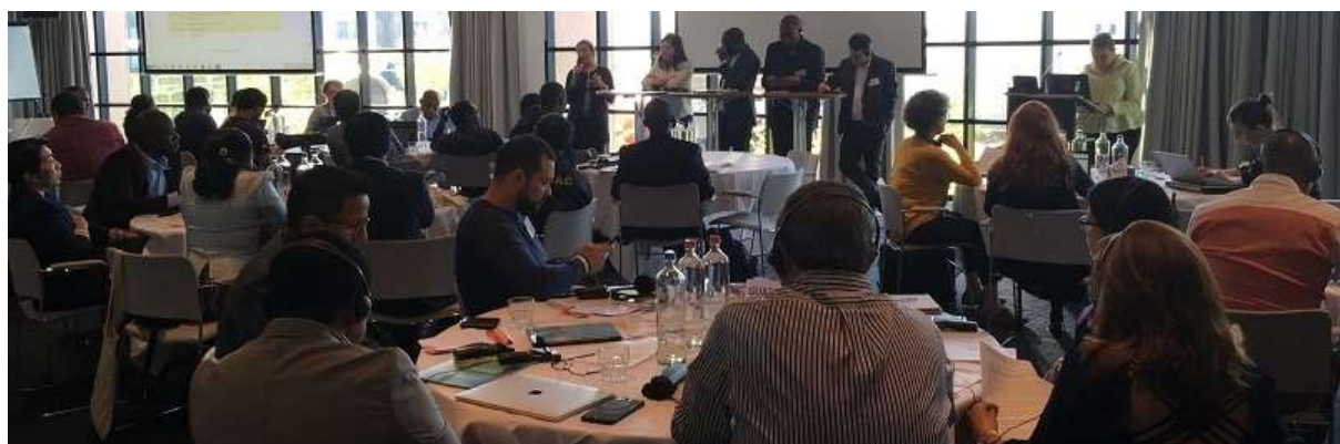
Table ronde lors de la Rencontre internationale PNIN, Amsterdam, 22-24 mai 2019

Simultanément, l'unité d'appui jouera un rôle clé pour aider les pays à élaborer et à mettre en œuvre / guider une « stratégie d'apprentissage et d'adaptation » et pour élaborer une stratégie d'apprentissage robuste au niveau international en saisissant la variabilité entre les pays afin de maximiser l'apprentissage tiré de cette expérience : qu'est-ce qui fonctionne dans quel contexte ?